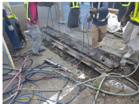
既設ジョイント撤去