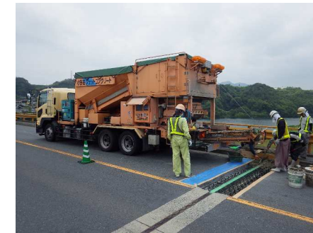
コンクリート打設