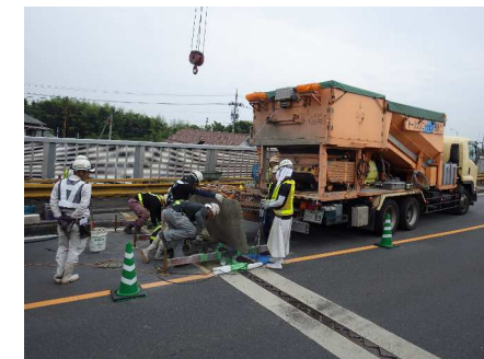
コンクリート打設