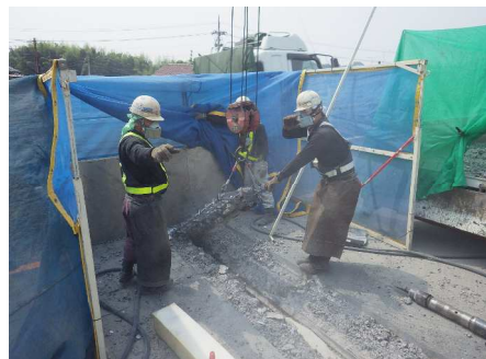
既設ジョイント撤去