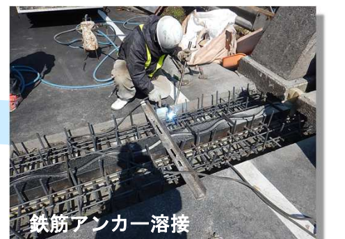
鉄筋アンカー溶接