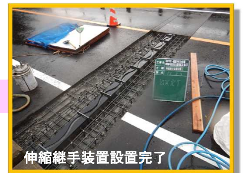
伸縮継手装置設置完了