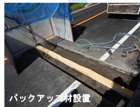
バックアップ材設置