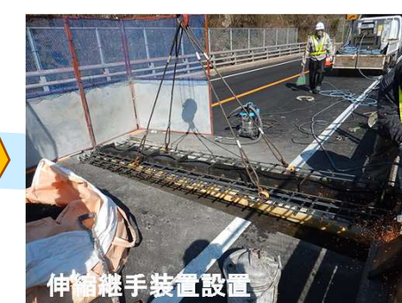
伸縮継手装置設置