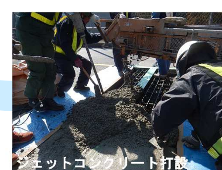
ジェットコンクリート打設