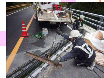
ジョイント据付状況