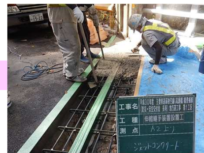
コンクリート打設状況