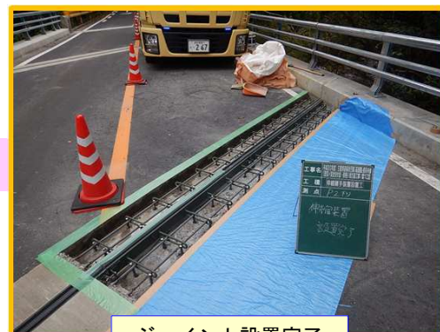
ジョイント設置完了