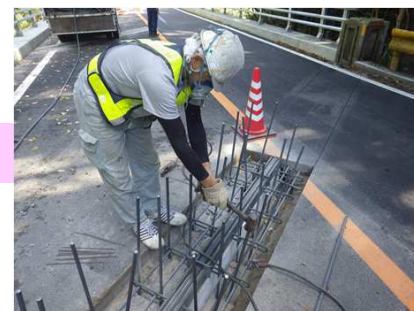
アンカー打込状況