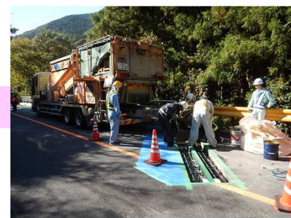
コンクリート打設状況