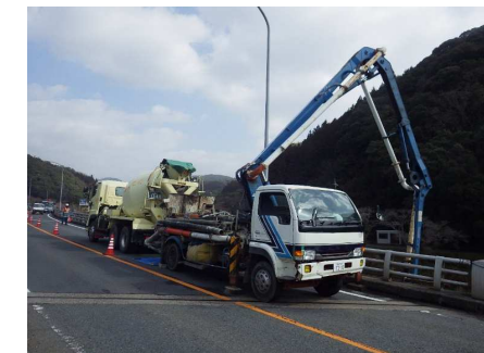
コンクリート打設