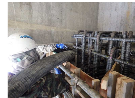
コンクリート打設