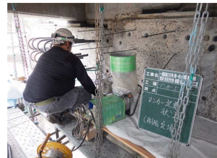
エポキシ樹脂充填