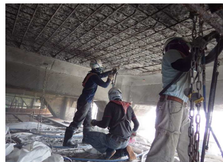
コンクリート撤去 ↓